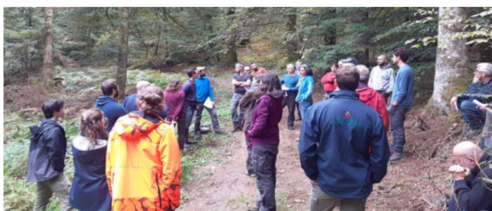
L'équipe du CRPF en tournée

Beaucoup de mouvement par conséquent ! Pour connaître vos interlocuteurs au CRPF, rendez-vous sur notre site internet : https://occitanie.cnpf.fr/n/vos-contacts-au-crpf/n:2525 .