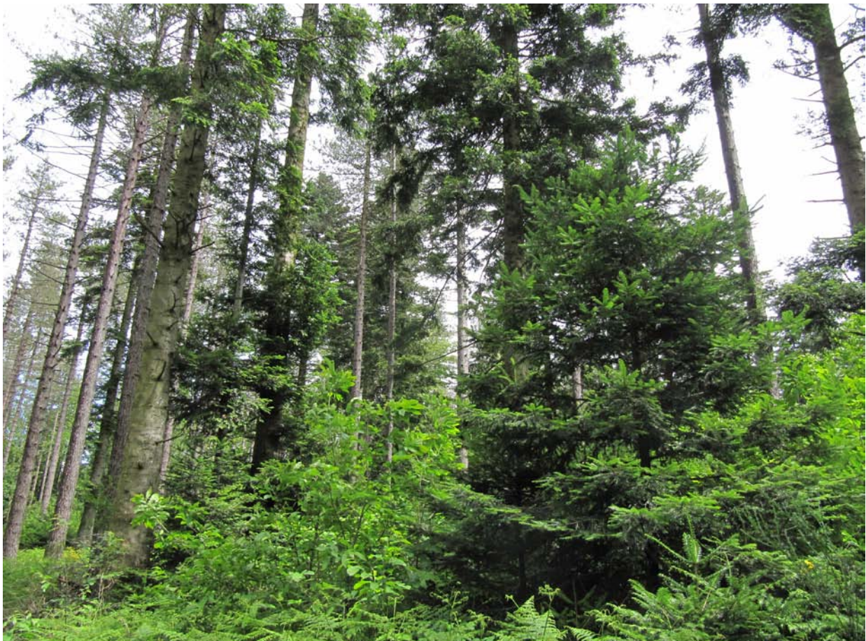
La régénération naturelle commence à s'installer sous les épicéas dépérissants.