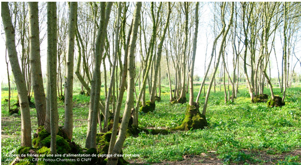
Cépées de frênes sur une aire d'alimentation de captage d'eau potable.

Pour un appui des techniciens et ingénieurs du CNPF sur la gestion de votre bois : cnpf.fr