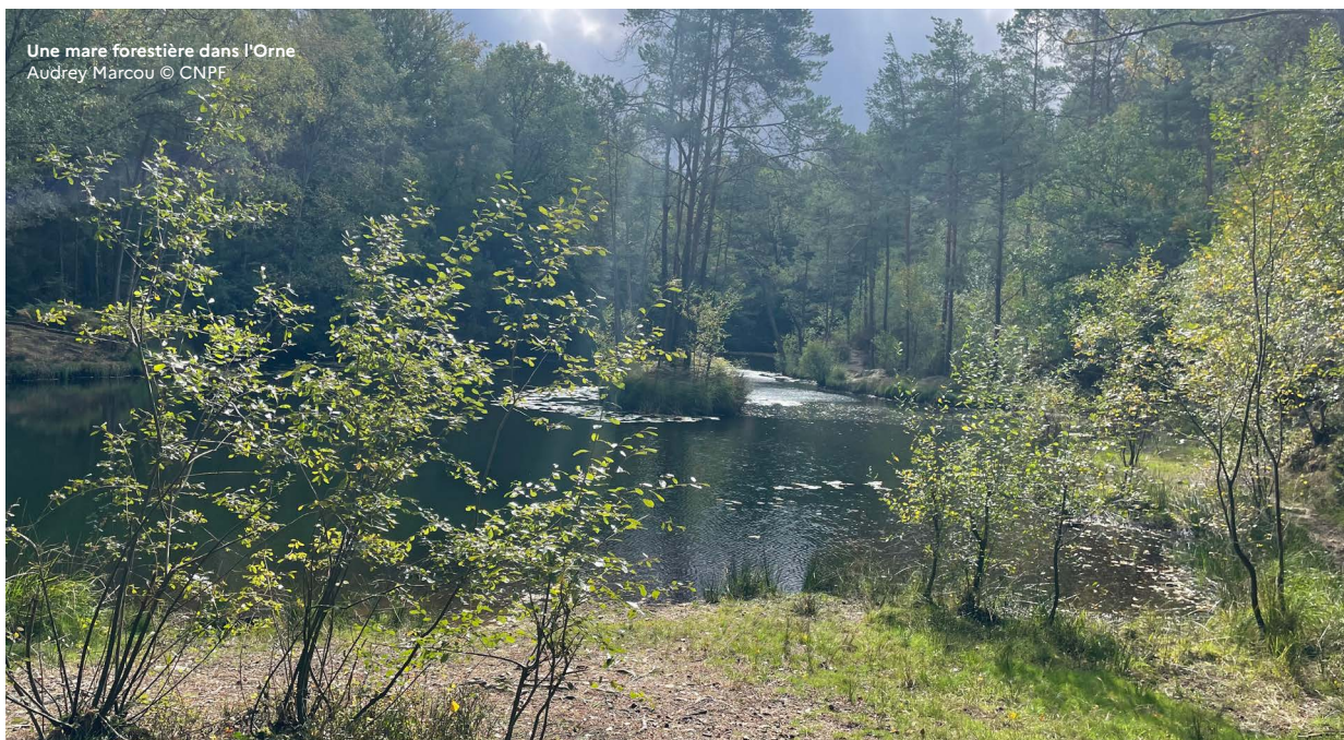
Une mare forestière dans l'Orne.

Pour un appui des techniciens et ingénieurs du CNPF sur la gestion de votre bois : cnpf.fr