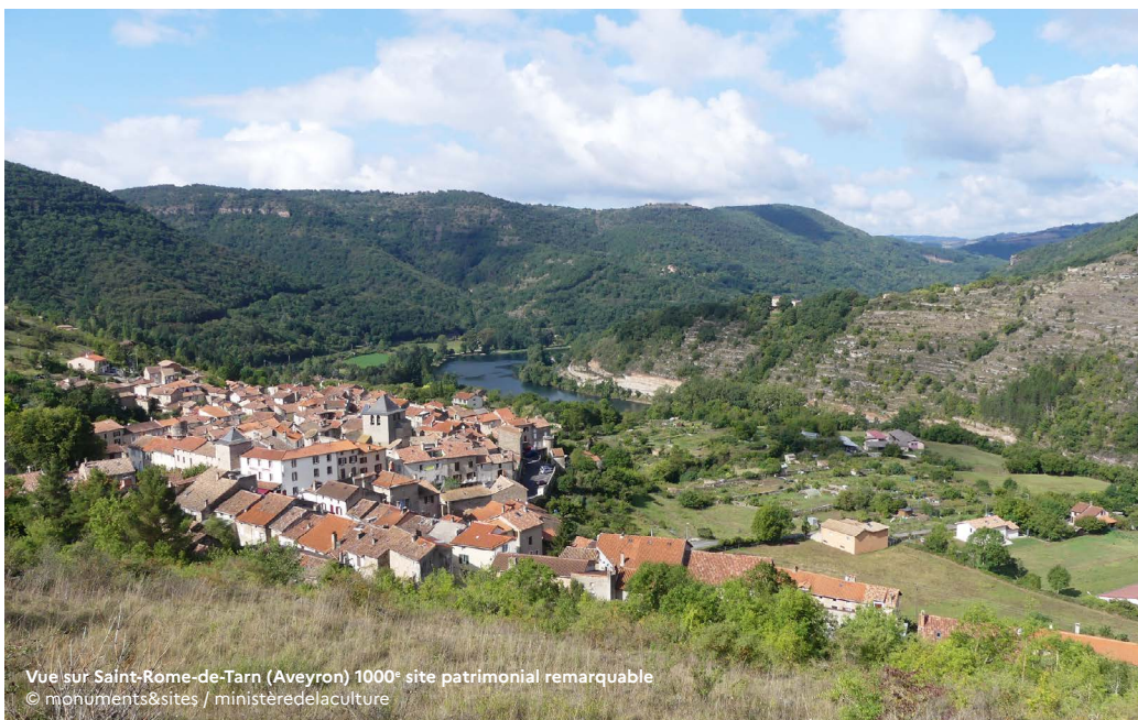
Vue sur Saint-Rome-de-Tarn (Aveyron) 1000* site patrimonial remarquable

Pour un appui des techniciens et ingénieurs du CNPF sur la gestion de votre bois : cnpf.fr