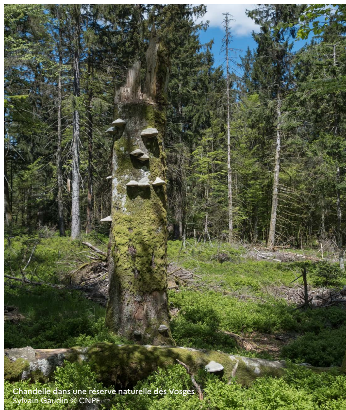
Chandelle dans une réserve naturelle des Vosges

Pour un appui des techniciens et ingénieurs du CNPF sur la gestion de votre bois : cnpf.fr