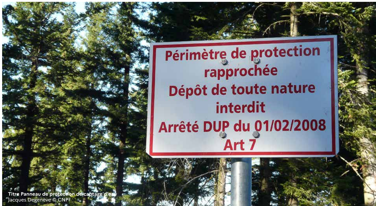
Titre Panneau de protection de captage d'eau

Pour un appui des techniciens et ingénieurs du CNPF sur la gestion de votre bois : cnpf.fr