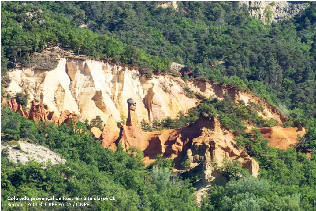
Colorado provençal de Rustrel - Site classé CE Bernard Petit © CRPF PACA / CNPF

Pour un appui des techniciens et ingénieurs du CNPF sur la gestion de votre bois : cnpf.fr