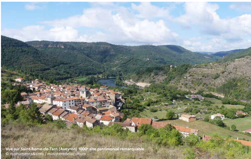
Vue sur Saint-Rome-de-Tarn (Aveyron) 1000 e site patrimonial remarquable

Pour un appui des techniciens et ingénieurs du CNPF sur la gestion de votre bois : cnpf.fr