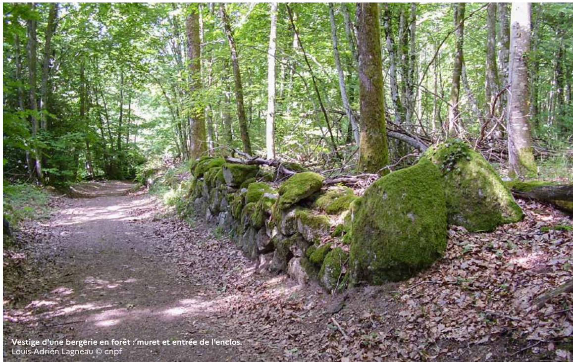
Vestige d'une bergerie en forêt : muret et entrée de l'enclos.

Pour un appui des techniciens et ingénieurs du CNPF sur la gestion de votre bois : cnpf.fr