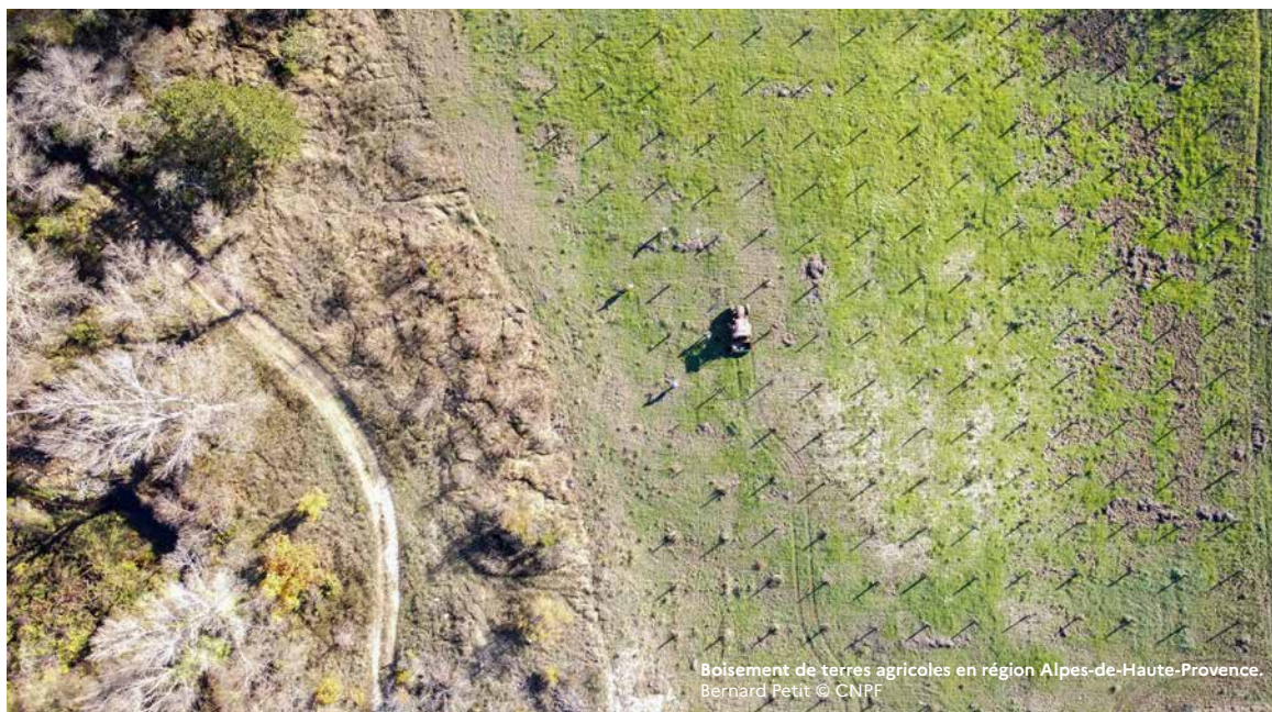
Boisement de terres agricoles en région Alpes-de-Haute-Provence.

Pour un appui des techniciens et ingénieurs du CNPF sur la gestion de votre bois : cnpf.fr