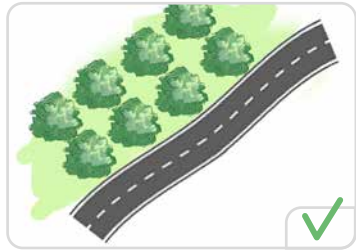
Un double alignement unilatéral

Extraits du guide - Appui à l'instruction des dérogations au régime de protection Rapport d'étude avril 2024 – Ministère de la transition écologique et de la cohésion des territoires et Cerema