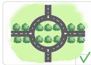
Lors de l'aménagement d'un carrefour, les anciens arbres d'alignements sont intégrés dans la partie centrale du rond-point

Des plantations accompagnant une voie, organisées en une succession de modules, composé à minima de deux arbres et répété sur un rythme régulier, sont considérées comme un alignement.