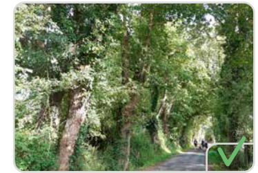
Des arbres dans une haie de bocage

Seule une plantation régulière d'arbres peut être considérée comme un alignement. Donc selon les projets, un alignement d'arbres peut être intégré à un aménagement du type boisement urbain.