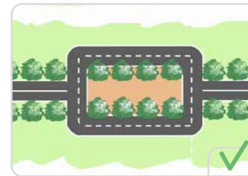
Dans le cas où l'aménagement de la place/esplanade est juxtaposé mais indépendant et donc détaché du tracé de la voie

Dans le même esprit, ces arbres rescapés forment un ensemble cohérent avec ceux qui bordent la voie.