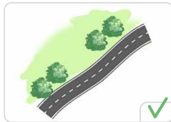
Un module répété le long d'une voie

Le cheminement de l'ancienne voie est souligné par les arbres d'alignements qui sont détachés par endroit du nouveau tracé (par exemple, le long de virages qui ont été modifiés). Pour autant, ces arbres forment un ensemble cohérent, en lien avec l'histoire du lieu. Ils sont donc considérés comme un alignement d'arbres en bonne et due forme.