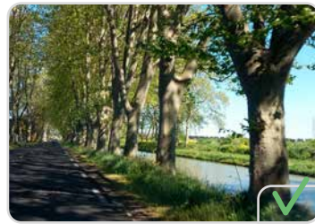
Les plantations ordonnées qui forment des alignements multiples

Dans les cas où les alignements (constitués par des arbres d'essences homogènes ou mélangées) ont été volontairement plantés pour accompagner le tracé de la voie, ces alignements multiples forment un ensemble indissociable.