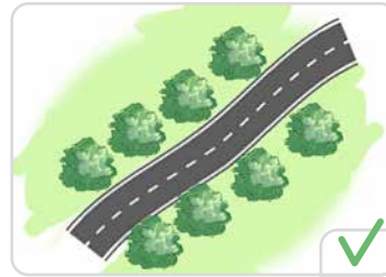
Un alignement ou alignement bilatéral composé d'espèces différentes

Dans les cas où les alignements (constitués par des arbres d'essences homogènes ou mélangées) ont été volontairement plantés pour accompagner le tracé de la voie, ces alignements multiples forment un ensemble indissociable.