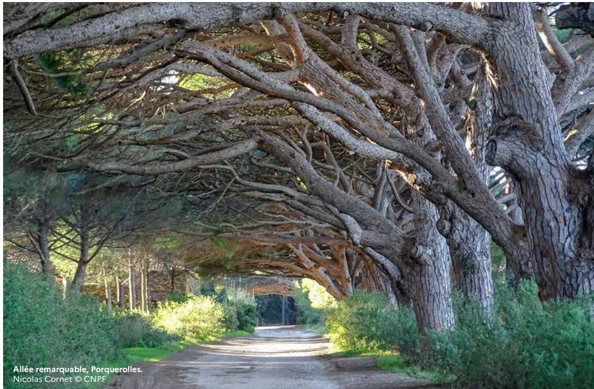
Allée remarquable, Porquerolles.

Pour un appui des techniciens et ingénieurs du CNPF sur la gestion de votre bois : cnpf.fr