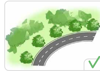
Les arbres dans les boisements urbains

Seule une plantation régulière d'arbres peut être considérée comme un alignement. Donc selon les projets, un alignement d'arbres peut être intégré à un aménagement du type boisement urbain.