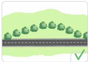
Une déviation, une rectification d'une voie

Une plantation régulière, intégrée dans un système de haie bocagère est considérée comme un alignement.