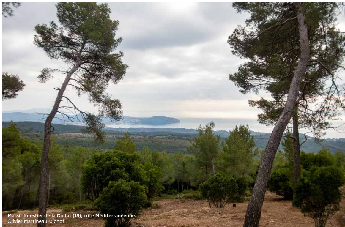
Massif forestier de la Ciotat (13), côte Méditerranéenne.

Pour un appui des techniciens et ingénieurs du CNPF sur la gestion de votre bois : cnpf.fr