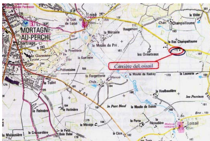
Figure 3 : Extrait de la carte IGN 1816 ET

L'entrée de la cavité se trouve en bordure immédiate de la route départementale n°8, à sept kilomètres au sud-est de Mortagne-au-Perche, à proximité du lieu-dit "le Bas Champillaume" (figure 3 et 4).