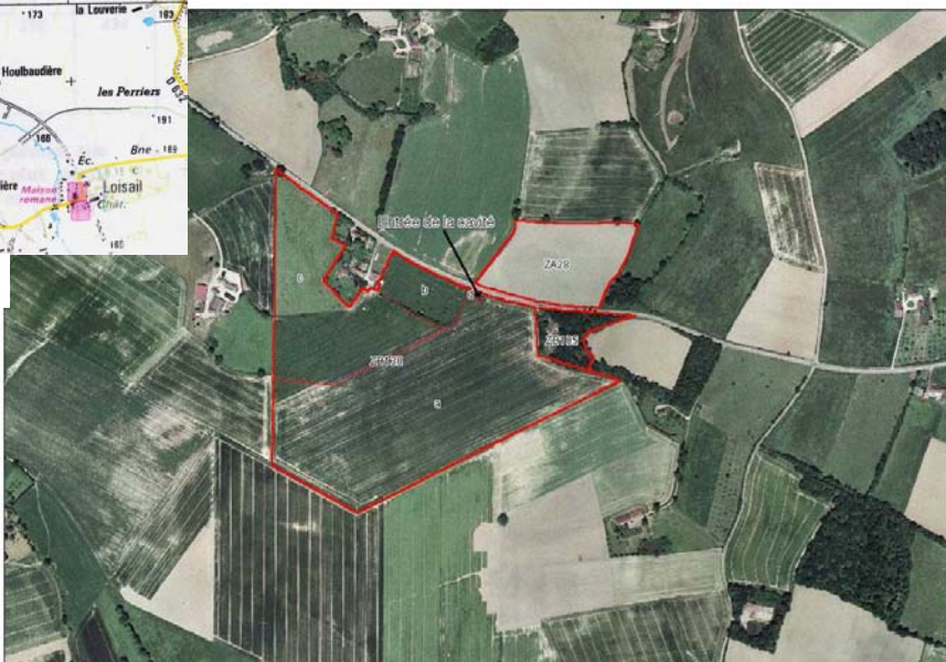
Figure 4 : Vue aérienne de la cavité et extrait cadastral