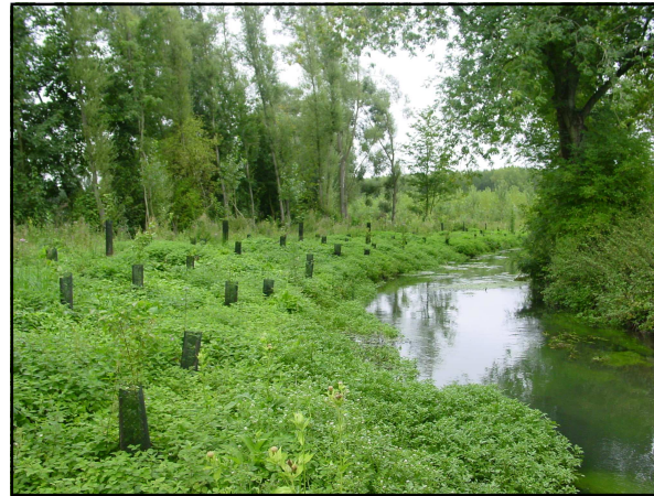
Plantation diversifiée en bordure de peupleraie

En zone d'élevage (pâture), toute plantation doit s'accompagner de l'installation d'une clôture et d'abreuvoirs, afin de protéger les arbres et limiter l'accès des bovins aux berges.