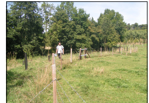
Jeune plantation en bordure de pâture avec clôture

Contactez le CRPF pour plus de renseignements.