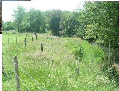
Evolution du site de Boubers-sur-Canche (62)

Crédits photographiques et sources des illustrations: