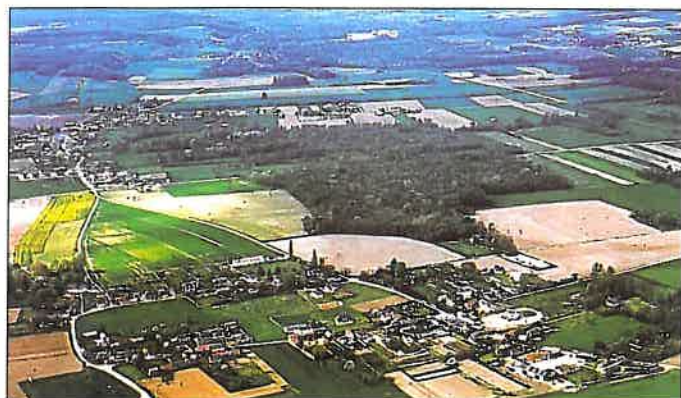
Quel est l'avenir de ma petite forêt ?

Vous êtes propriétaire d'un petit massif forestier, entre 10 et 25 hectares : vous pouvez déposer un Plan Simple de Gestion Volontaire (PSG)